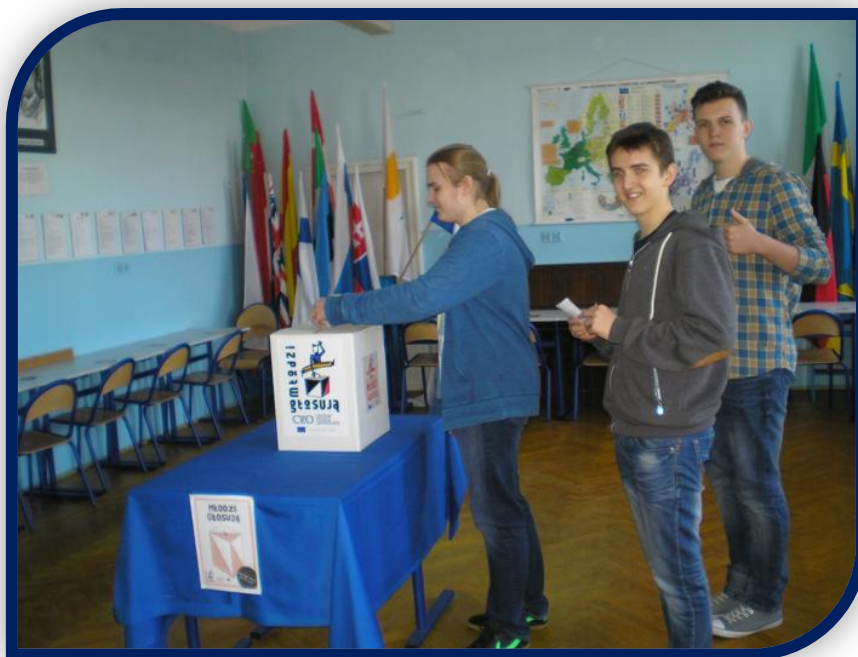
Decyzja podjęta – nasz kandydat najlepszy