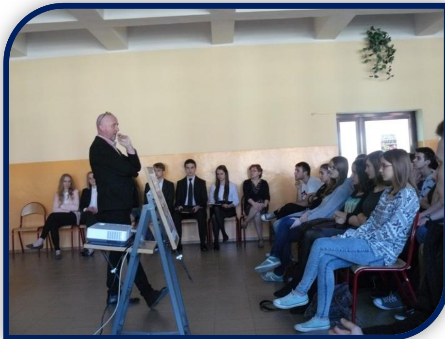
Artykuł opisujący wydarzenie, wysłany do prasy.