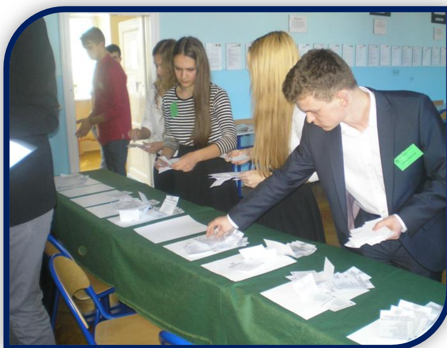
Ale dużo liczenia...