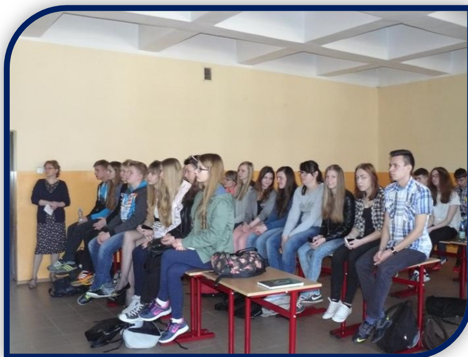
Młodzież była bardzo zainteresowana tematyką spotkania