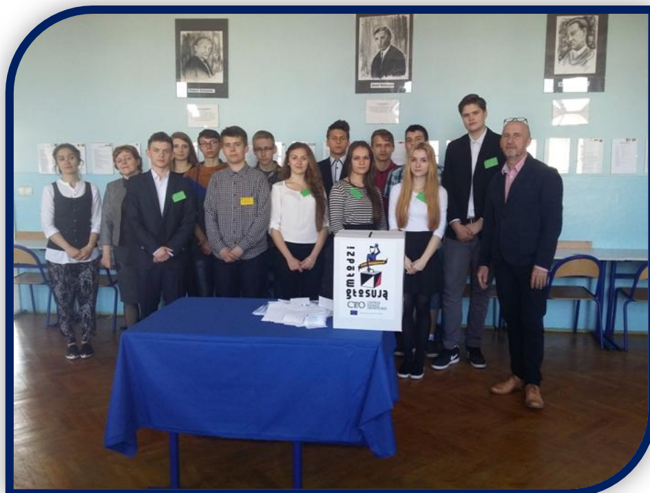
Udało się, za chwilę trzeba brać się do pracy