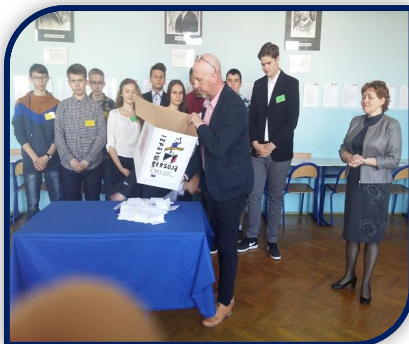
Oj ostrożnie, żeby nic nie zginęło