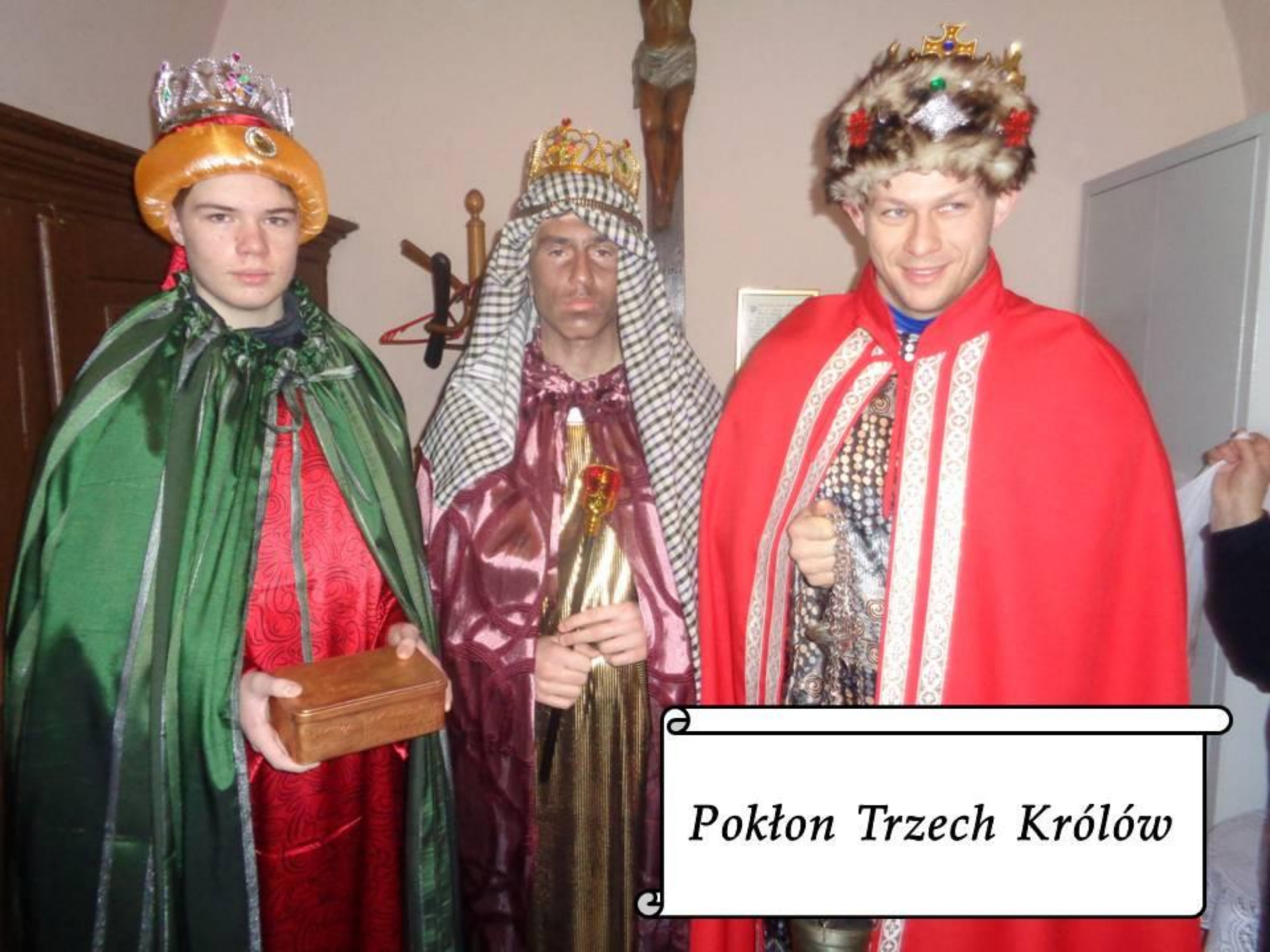
Pokłon Trzech Królów